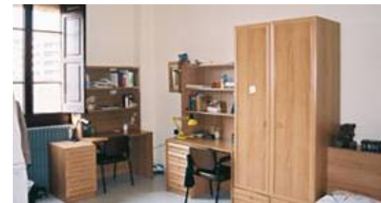
Unidad de alojamiento

Tanto el baño, como la cocina y la sala de estudios son de uso compartido por todos los residentes.