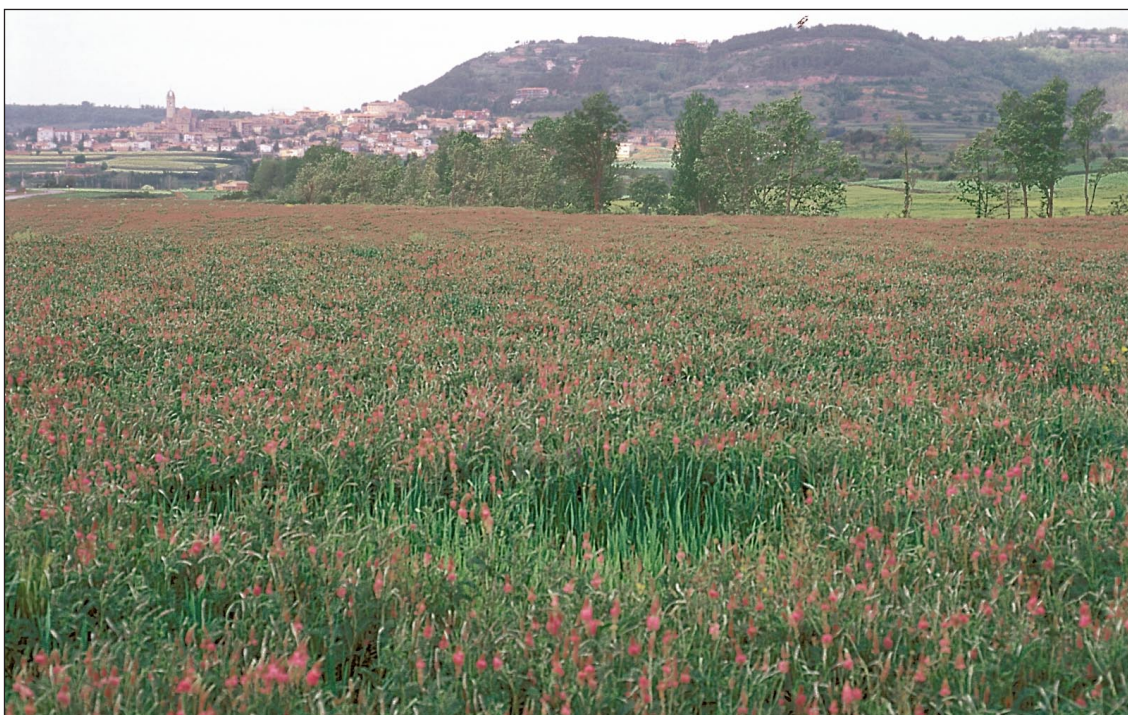
Moià (Bages) 11 de maig de 2001

La esparceta se ha cultivado tradicionalmente y se destina a producir forraje conservado (heno y ensilado, como en el caso de la imagen inferior)