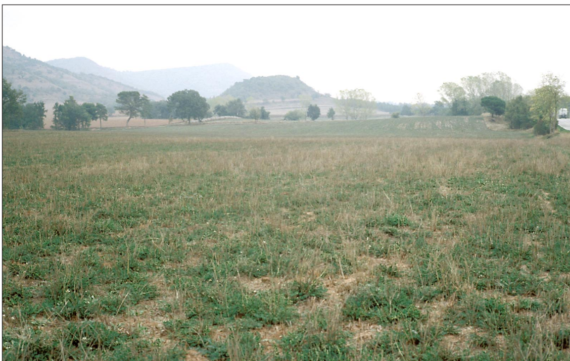
Moi• (Bages) 17 de octubre de 2001

La esparceta se ha cultivado tradicionalmente y se destina a producir forraje conservado. En este caso, despu•s del corte de primavera-verano, no se ha aprovechado en pastoreo