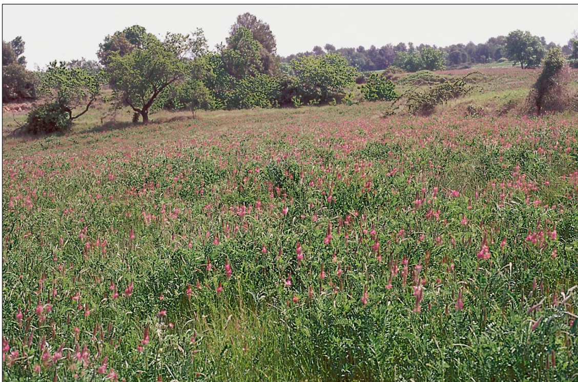
Moià (Bages) 11 de maig de 2001

La esparceta se ha cultivado tradicionalmente y se destina a producir forraje conservado (heno y ensilado, como en el caso de la imagen inferior)